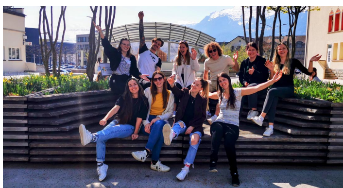
Das Aha bietet dieses Jahr zwei Kurse an, die die Fähigkeiten junger Erwachsener erweitern sollen.