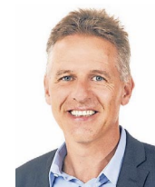
Wendelin Lampert FBP-Landtagsabgeordneter

Wenn Sie jetzt die Steuerberechnung mit eTax durchführen, werden Sie erfreut feststellen, dass die im Voraus einbezahlten Steuern mit einem Prozent verzinst werden und Sie somit im Jahr 2023 entsprechend weniger Steuern bezahlen werden bzw. im Herbst 2024 einen höheren Betrag zurückerhalten werden. Zum Glück haben 16 Landtagsabgeordnete den entsprechenden Antrag unterstützt und der Regierung damit ein eindeutiges Zeichen gegeben. In Summe werden wir somit alle ca. eine Million Franken weniger Steuern bezahlen.